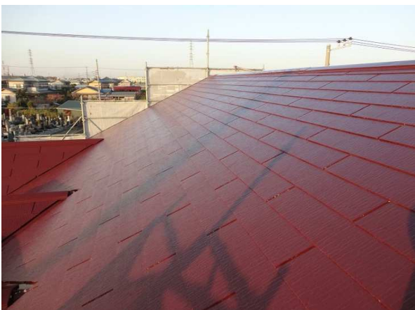
⑤屋根塗装工事完了