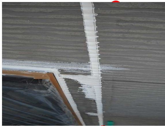
②劣化部シーリング及びその他補修