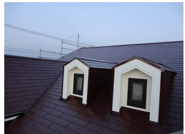
⑥屋根塗装工事完了