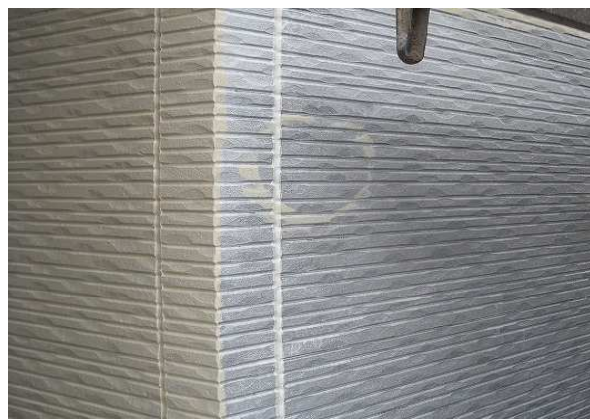
④板間目地シール撤去打替え