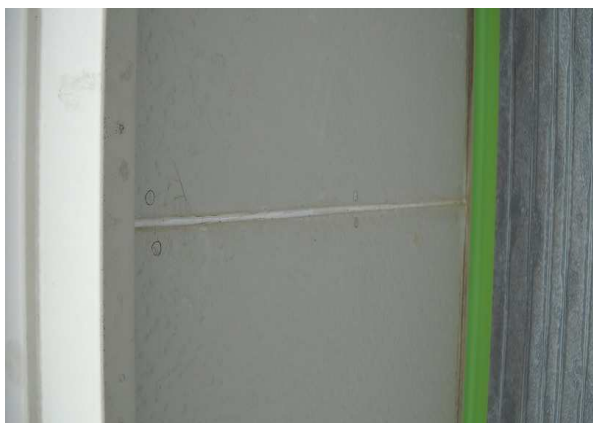
⑤軒天ジョイント部シール補修