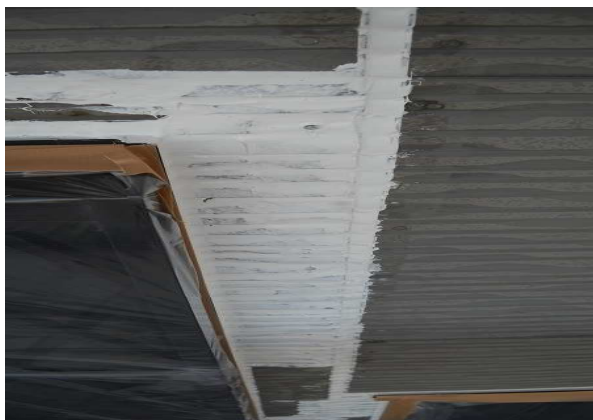
③開口部・板間目地シール撤去打替え